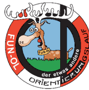
FOTO- OL 1