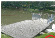
Foto- OL 1 Schreibe die Ziffer in den blauen Kreis beim dazuge- hörigen Bild!